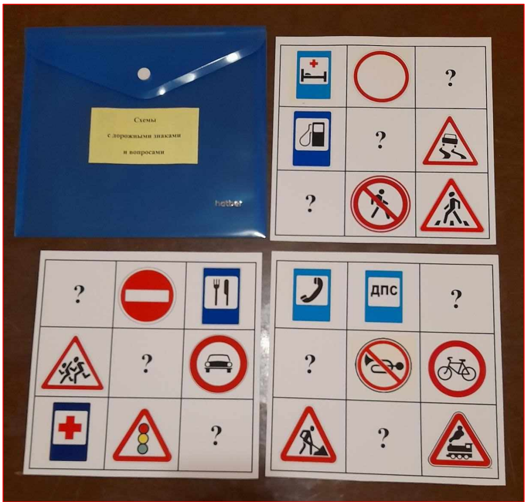
Схемы с вопросами