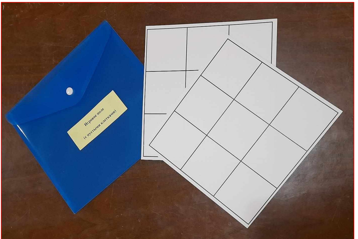
Игровое поле с пустыми клетками